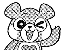
けんこうくまちゃん