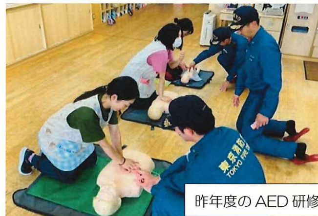
昨年度のAED研修の様子