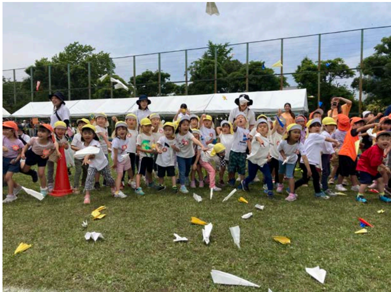
「おひさま保育園交流運動会」